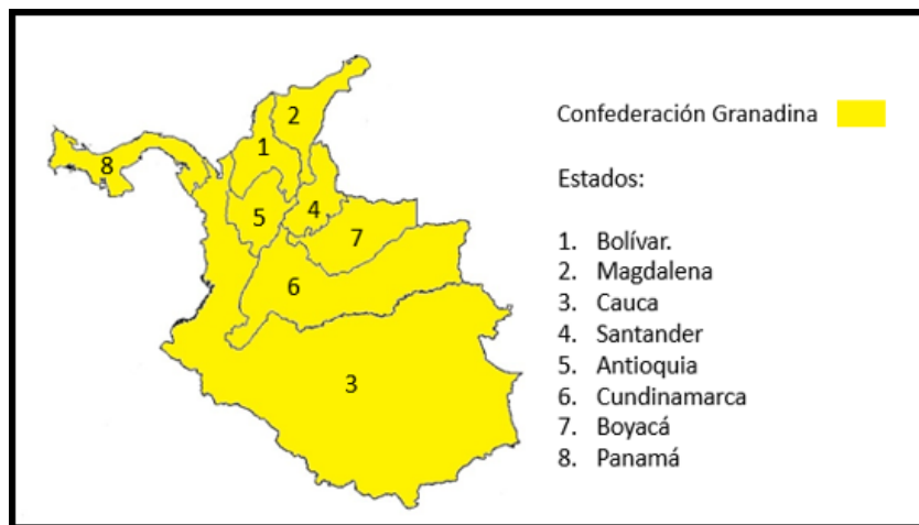
Mapa 1. Confederación Granadina 1858-1861