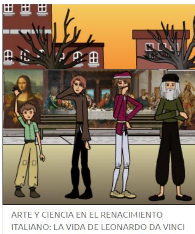
Imagen 1. “Portada de la novela gráfica”, 2020