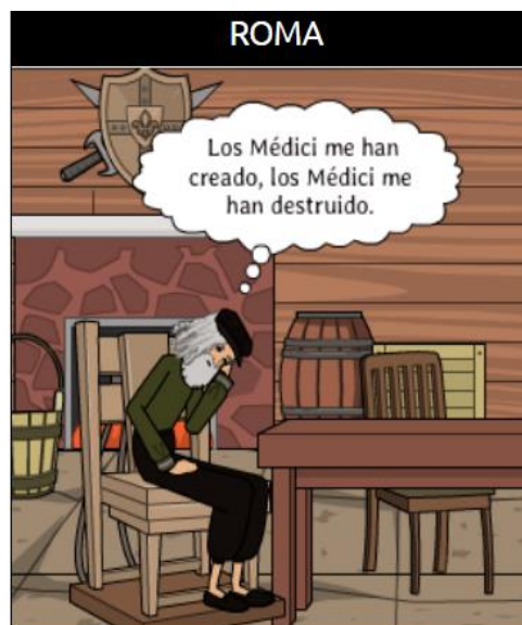
Imagen 5. “Leonardo y la familia Médici”, 2020

Fuente: Leonardo y la familia Médici, Pixton , 2020 8 .