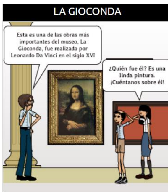
Imagen 6. Niños y guía en el Museo de Louvre, 2020