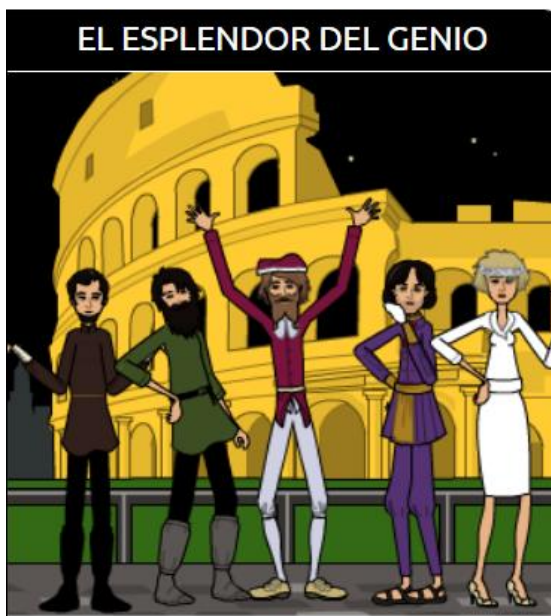
Imagen 7. Distintos personajes y vestuario usado según su labor, 2020

Fuente: “Distintos personajes y vestuario usado según su labor”, Pixton , 2020 21 .