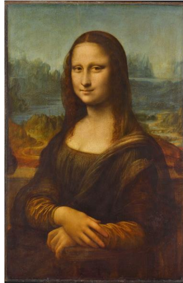
Imagen 4. Leonardo da Vinci, La Gioconda , 1503

Fuente: Leonardo da Vinci, La Gioconda , 1503, óleo, Museo de Louvre, París.