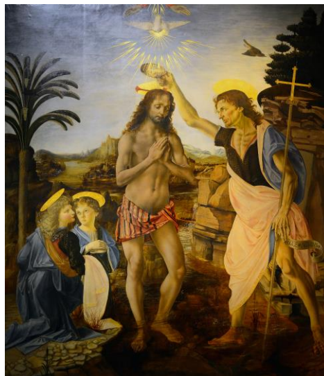
Imagen 2. Leonardo da Vinci, 1472-147

Fuente: Leonardo da Vinci, Bautismo de Cristo , 1472-147, óleo, Galería Uffizi, Florencia.